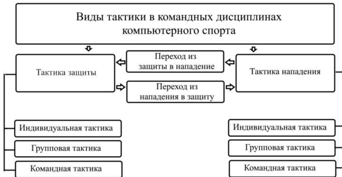
Рис. Виды тактики в командных дисциплинах компьютерного спорта

Виды тактики в командных дисциплинах в компьютерном спорте происходит одновременно. Каждая тактическая задача соподчинена основной тактической задаче на матч и как правило зависит уровня игры противника и от соревновательной обстановки матча. Первую часть киберспортивного матча разделяют на две стадии: а) борьба в неопределенных позициях и б) борьба в определенных позициях. Вторую часть киберспортивного матча можно условно назвать «завершением игры». Как правило, наиболее сложной является первая стадия первой части киберспортивного матча, именно здесь команды и игроки стараются максимально реализовать подготовленные тактические приемы. Все технические приемы в цифровой среде в нападении и в защите относятся к средствам ведения игры. К методам ведения игры относят такие понятия как стиль: (агрессивный, комбинированный, пассивный), темп (быстрый, средний, медленный) и ритм (рациональный, нерациональный, стабильный, вариативный). Тактическая система игры – это организованный способ ведения борьбы, с распределением функций между игроками одной команды в защите и нападении в различных фазах игры, в соответствии с игровым амплуа.